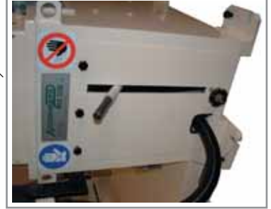
Sollevamento idraulico per ade- guarsi alle diverse altezze degli stampi Hydraulic height adjustment for the different moulds heights