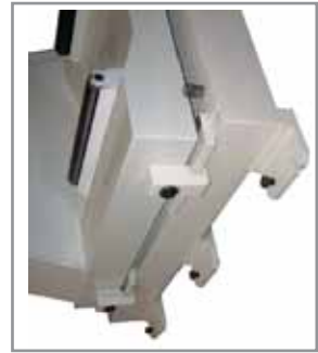
Traslazione Transversal movement