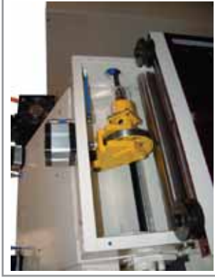
Ruota metrica per controllo posizionamento materiale Measuring wheel to control the position of the material