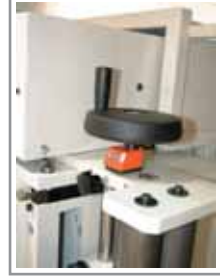
Guidanasari con indicatore numerico Entry guides with numerical gauge