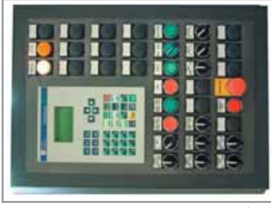
lego lego Pendant