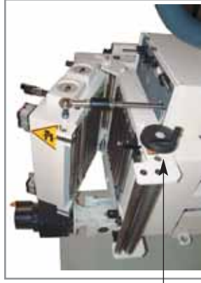
Apertura pneumatica della testa per la pulizia dei rulli e per lo sgancio piloti ad ogni colpo della pressa Pneumatic head's opening for rolls cleaning and complete opening of the upper part so that the strip can be released at each press stroke