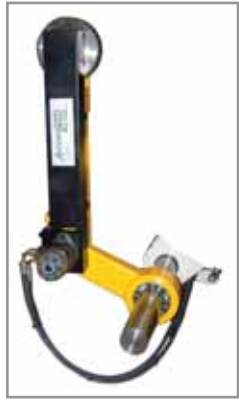
Braccio Pressore Pressure arm